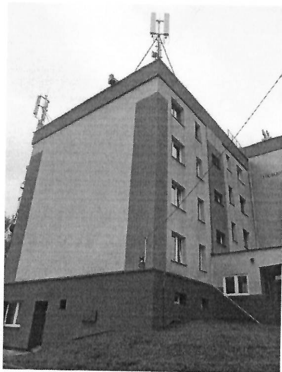
Zał. nr 1: Widok ogólny instalacji radiokomunikacyjnej.

Koniec sprawozdania. Sprawozdanie zawiera dodatkowo załączniki nr 1 i 2.