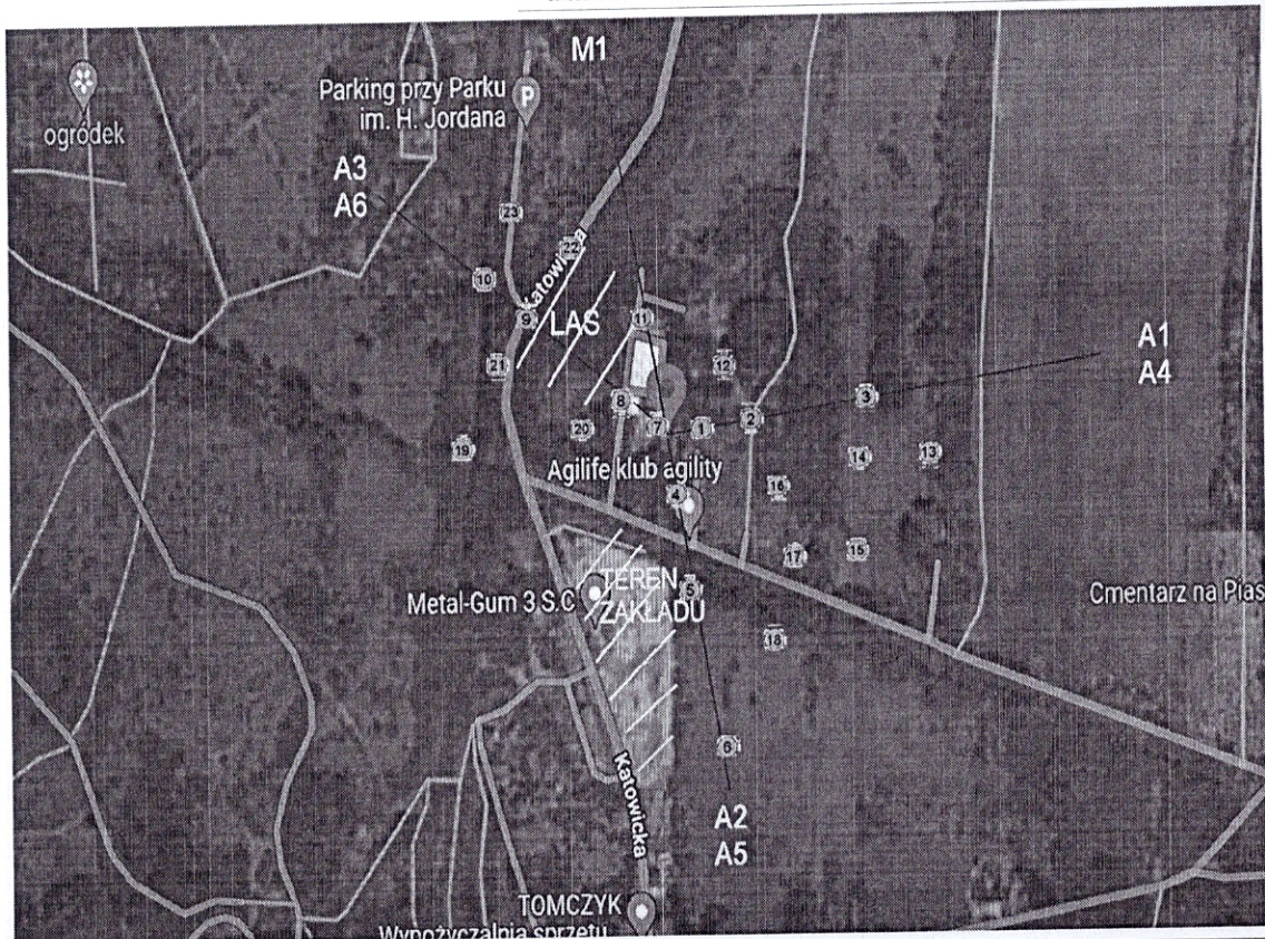
Azymuty anten P4