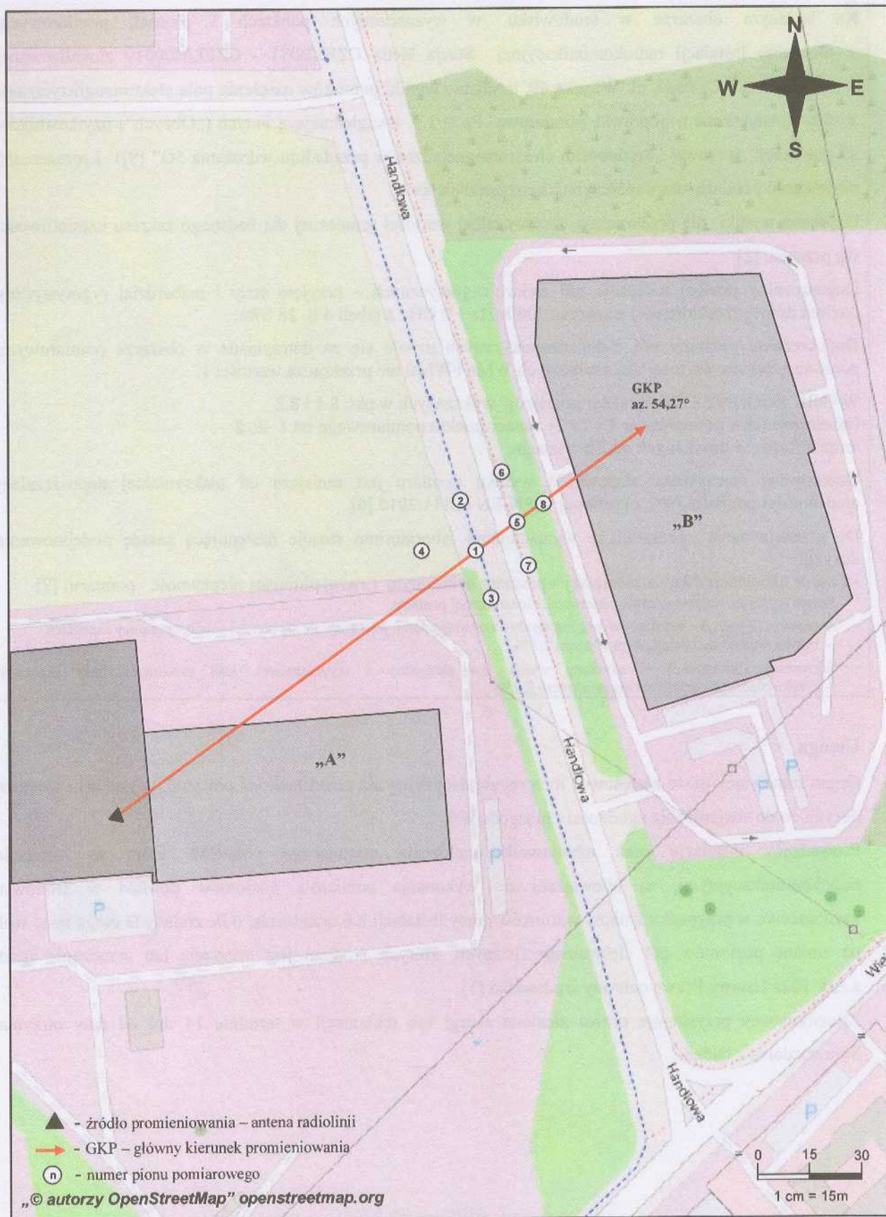
Rys. 1. Usytuowanie punktów i pionów pomiarowych w otoczeniu instalacji radiokomunikacyjnej Stacja Netia CZELB071-CZELM00019 Czeladź, ul. Wiejska 49