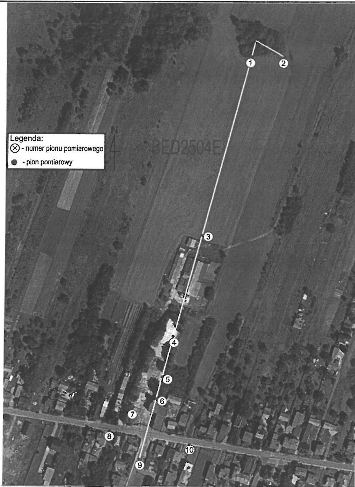
Zdjęcie satelitarne: Image © 2020 CNES/Airbus